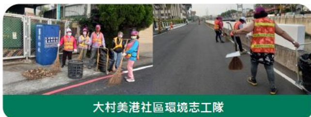
大村美港社區環境志工隊