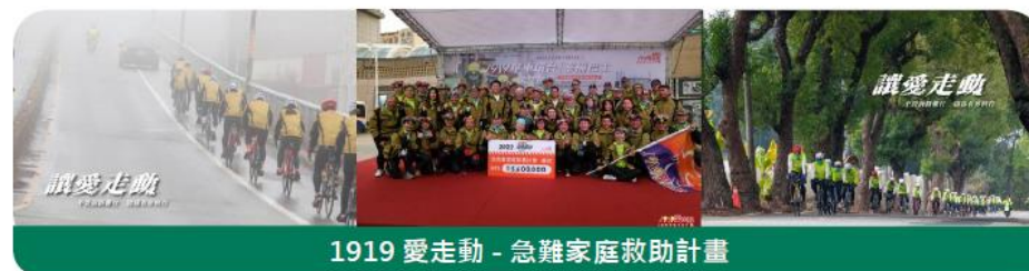
1919 愛走動 - 急難家庭救助計畫