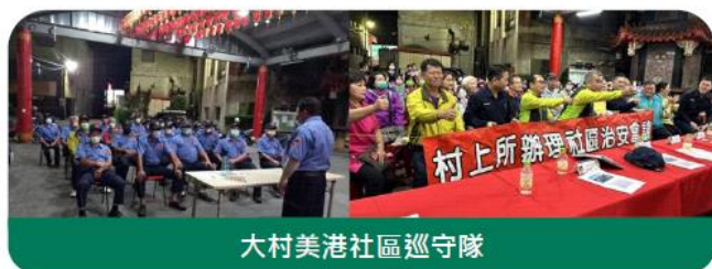
大村美港社區巡守隊