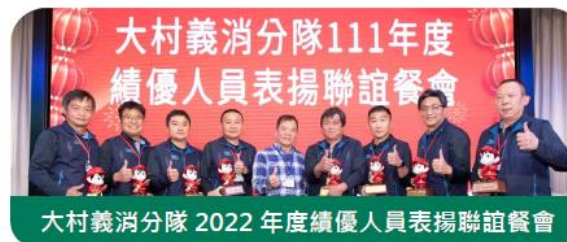
大村義消分隊 2022 年度績優人員表揚聯誼餐會